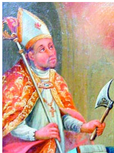
Der Heilige Wolfgang mit dem Beil, seinem Attribut.

Stufen hätten über den Wasserfall hierher geführt, so unser Führer. Auf ihnen konnten Pilger von der nahe vorbei verlaufenden Salzstraße zur Kapelle herabziehen. Nach ihr entstand auch erst der Beiname „bei St. Wolfgang“ des Dörfleins Röthenbach. Diese Wolfgangskapelle, die älter war, als die heutige Pfarrkirche, fiel einem Hochwasser im Jahr 1732 zum Opfer. Von dieser mysteriösen Kapelle zeugen heute lediglich ein in den Fels gehauenes ornamentales Wappen und ein Brettverschlag. Er verbirgt eine Höhlung im Stein.